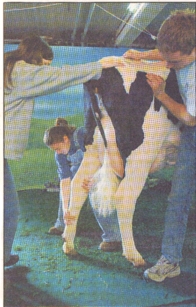
Les assistants photographes ajustent la position de la vache, au centimètre près.

BULLE • Affluence record au rendez-vous incontournable des éleveurs de Holstein. Les plus belles vaches se sont fait tirer le portrait par des professionnels. Reportage.