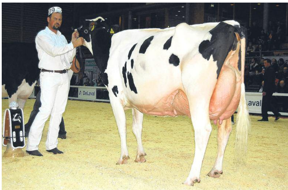
Beauty, championne du pis Holstein.

que lors de l'édition précédente, ce qui est certainement dû aux conditions météo ensoleillées. La fréquentation reste cependant très bonne surtout le dimanche», a-t-il relevé. Grand succès EXPO Bulle 2012 ferme donc ses portes sur un succès au terme de nombreux moments forts en émotion. Cette manifestation d'envergure reste un événement essentiel pour les éleveurs qui ont l'occasion de mesurer le fruit de leur travail lors des confrontations et de poursuivre ainsi le développement d'une génétique de pointe au sein de leurs troupeaux.